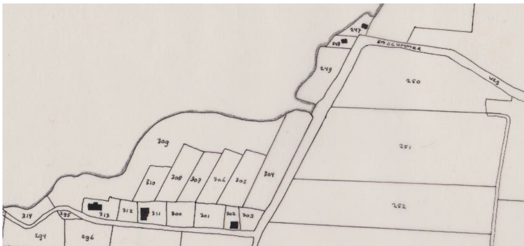
De Vinkebaan in 1832

Naast straten die in diverse jaarboeken behandeld zijn, is er al veel meer materiaal beschikbaar. Als voorbeeld de Vinkebaan, de straat tussen de spoorwegovergang in het verlengde van de Ruitersweg en de Bakkummerstraat. Het weiland de Vinkebaan wordt al in 1812 genoemd. Bij de start van het kadaster in 1832 (zie kaartje) zijn de drie percelen agrarisch gebied in handen van drie grootgrondbezitters. Alle stadia van bebouwing, vóór en na de aanleg van de spoorlijn, worden in het overzicht gevolgd, zowel van de noord- als de zuidkant. Gegevens over de bewoners tot de gedwongen afbraak van hun huizen in 1943 completeert het beeld van de oude Vinkebaan.