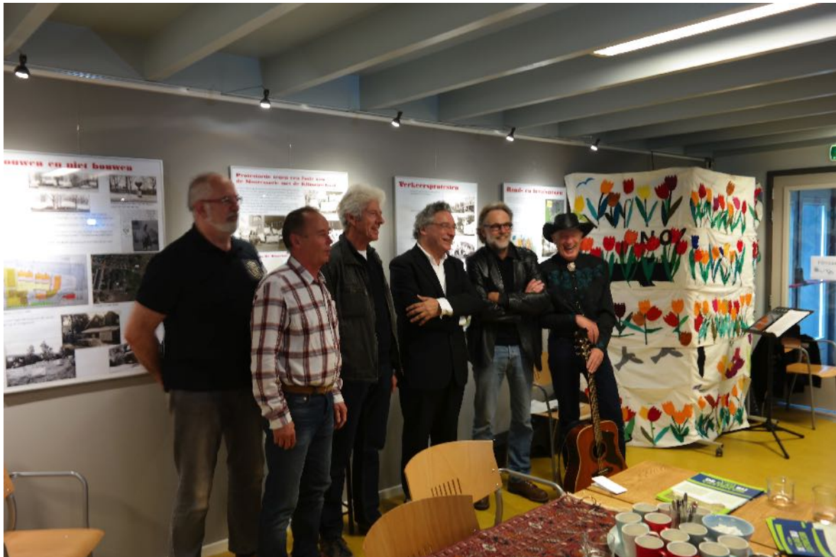
Leden van de Kabouterbeweging