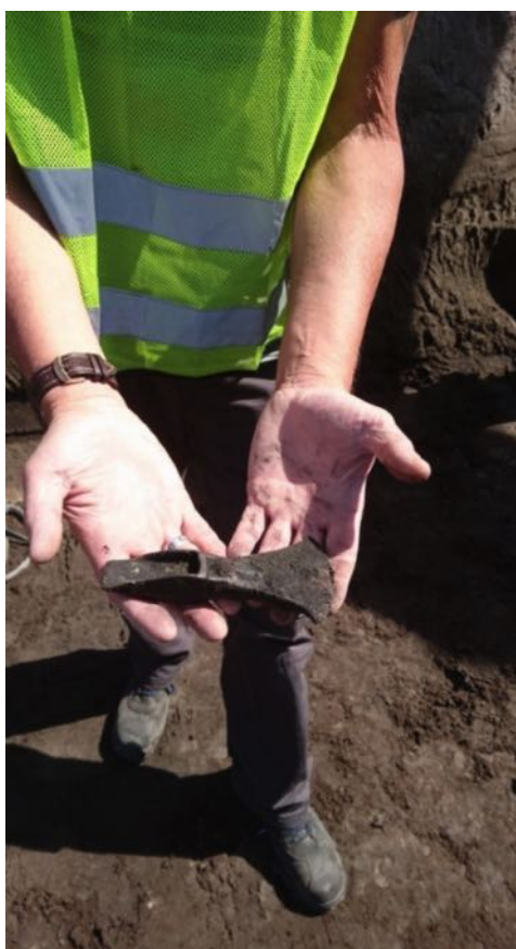
Foto van de gevonden bijl