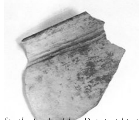
Streefband aardewerk langs Dorpsstraat dateert uit de Late IJzertijd

Aanvankelijk speelden in Castricum amateurs een zeer belangrijke rol. Zij bezitten in de gemeente de lokale kennis van het bodemarchief. De gemeente kan bijvoorbeeld de voorwaarde opnemen dat een archeologiebedrijf amateurs betreft bij het uitvoeren van het onderzoek. Op locaties, waar geen onderzoek nodig is, kunnen amateurs zelfstandig waarnemingen doen. De gemeente Castricum kan in deze een beroep doen op de amateurs van de Regio Werkgroep Oer-IJ, die bestaat uit vertegenwoordigers van Heiloo, Egmond, Castricum/Akersloot/Limmen, Uitgeest, Heemskerk/Beverwijk en Zaanstad. Velen zijn aangesloten bij de Archeologische Werkgemeenschap Nederland (AWN) en bij de op 9-11-2011 opgerichte afdeling 9 daarvan.