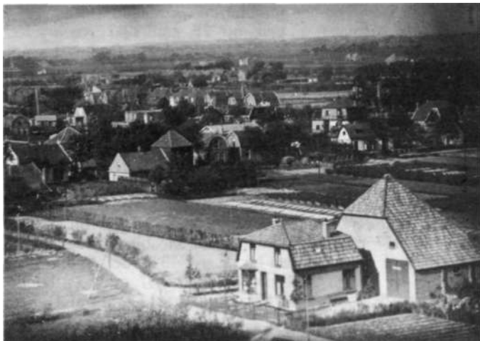
Afbeelding 13 De tweede boerderij nabij de Puikman.