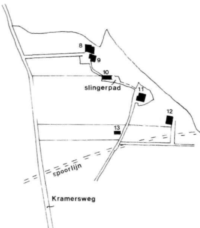
Afbeelding 2 Het buurtje aan de Duinkant - vroeger woonbuurt van vele Stuijbergens.