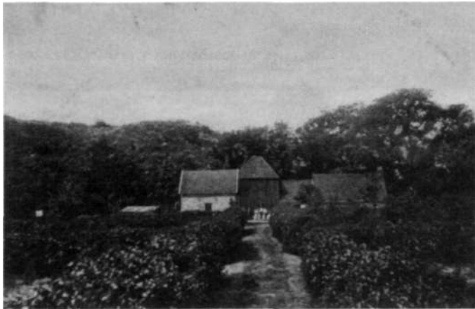
Afbeelding 12 De eerste boerderij de Papenberg' van Pieter Stuifbergen.