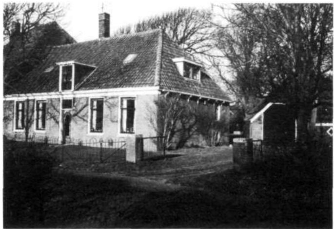
Afbeelding 1 De meest fraaie boerderij aan de Breedeweg (nr 72).