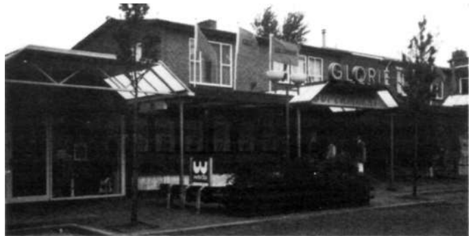
Afbeelding 15 De supermarkt aan de Torenstraat, sinds oktober 1983 verleden tijd.