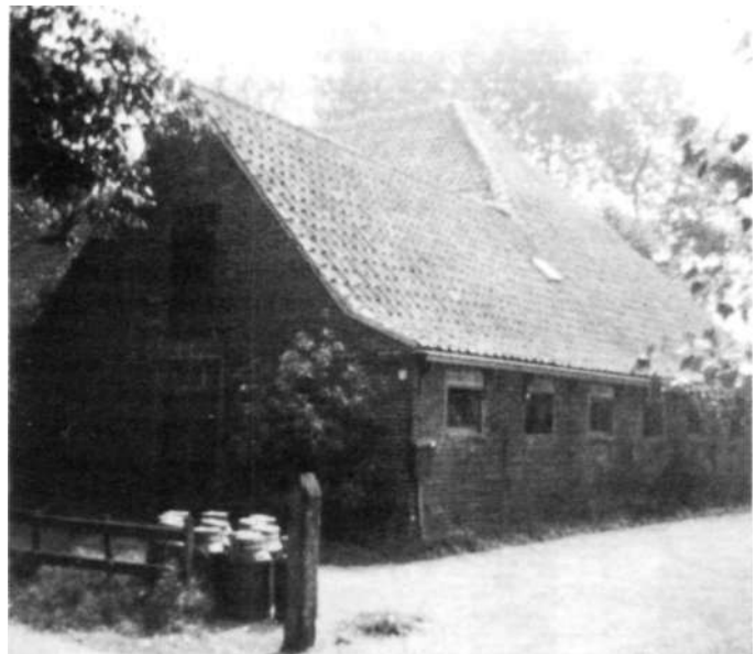
Afbeelding 18 Achterzijde boerderij Breedeweg nr 75.